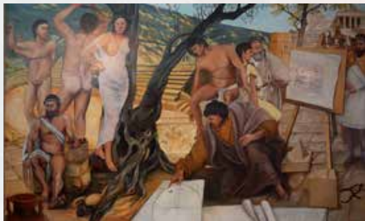
La Scuola Atletica - La Scuola Medica