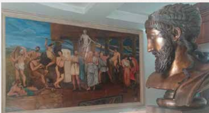
La Scuola Filosofica di Pitagora

PER INFORMAZIONI Proloco Crotona cell. 329.8154963