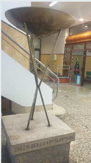
Braciere Olimpiadi Roma 1960