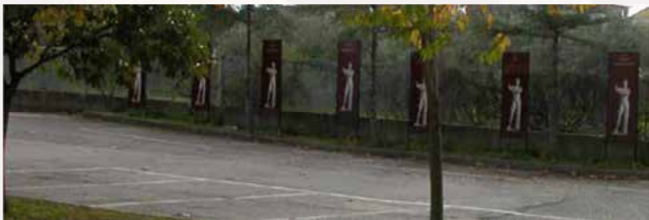
Tabella dei vincitori

Si è creato un luogo per valorizzare gli atleti vincitori negli agoni sacri Panellenici affinché possano suscitare interesse nei giovani, per educarli al gusto e all'amore del nostro patrimonio storico-culturale e per formare bravi cittadini che hanno coscienza e conoscenza delle eccellenze del Territorio e della propria identità, guardando al futuro con fiducia e impegno civile.